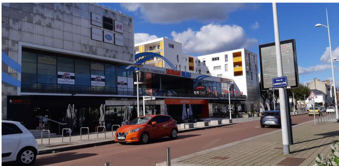
Centre commercial le Ruban Bleu